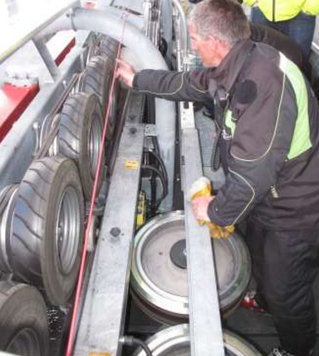
Passage du câble